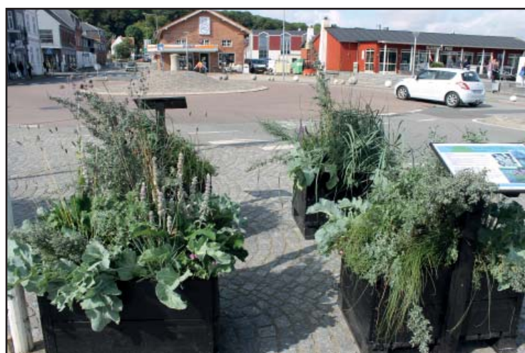
“Havhaven” med klitvegetation og andet