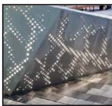
Inspirationsfotos til opholdsmøbel i beton og træ, stribet belægning og skærme.