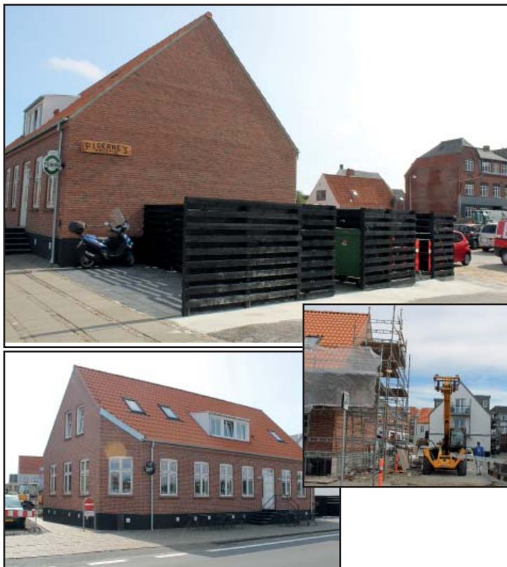
Renovering med tilskud af restaurant "Pigerne" for enden af Weibelsgade