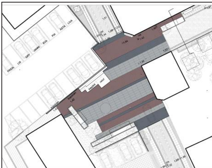
Områdefornyelsesprojekt med nyt torv og gadeforløb i Weibelsgade, som forbinder By og Havn, udført af Arkplan.