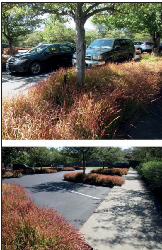
Inspirationsfotos til Parkeringspladser