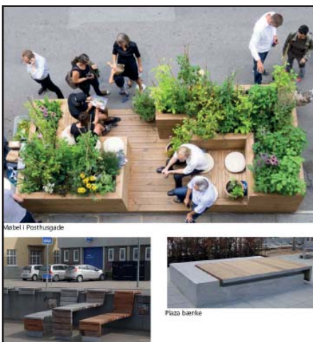
Inspirationsfotos til opholdsmøbel i beton og træ, stribet belægning og skærme.