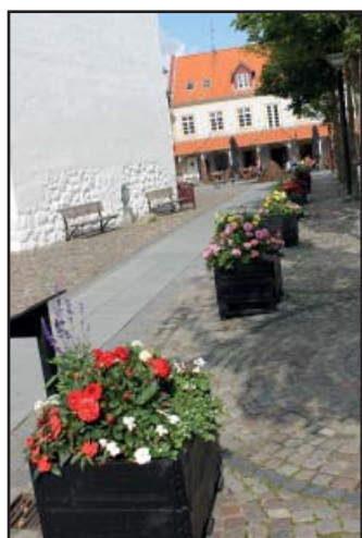
“Mormorhaven” med broget blomsterflor