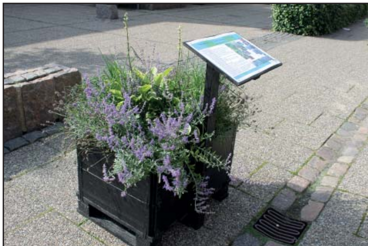
“Sansehaven” med spiselige planter